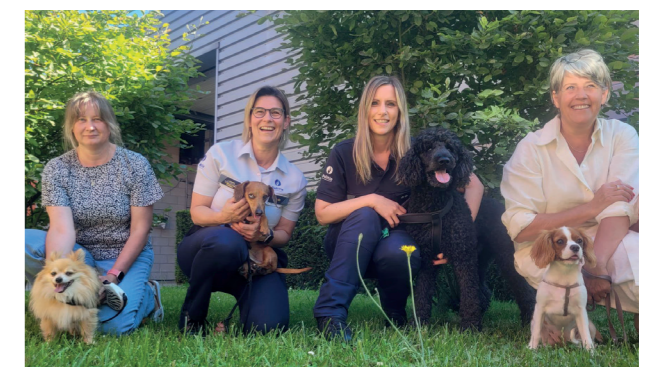
Aantal melding dierenverwaarlozing PZ BHT

Honden Gusto, Herman, Sam en Merlot kwamen het korps vergezellen. Gedurende de reguliere werkpauses konden de viervoeters en hun baasje even de benen strekken en van een verfrissende wandeling genieten.